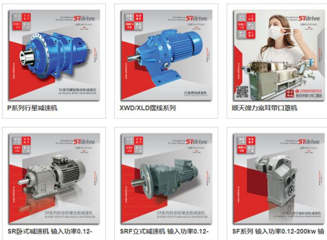
图 1-1 主要产品